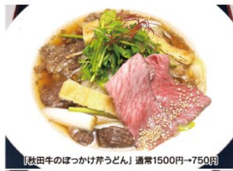
「秋田牛のぼっかけうどん」通常1500円→750円