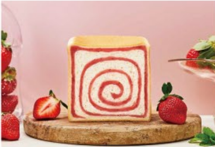
甘美あまおう苺あん 一斤1,200円(税込)