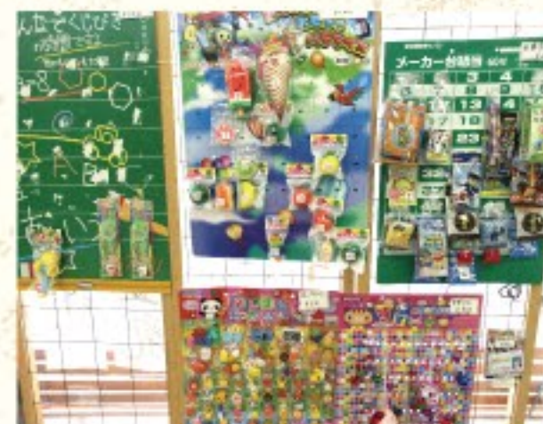
駄菓子の種類だけでなく、子ども達に人気の「くじ」も充実。

本間酒店 秋田市泉中央2丁目27-28 営業時間/8:00~19:00 TEL.018-823-0731