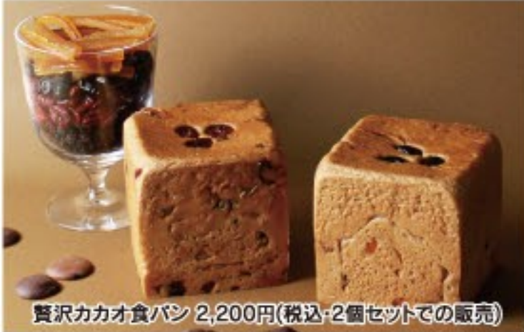
贅沢カカオ食パン 2,200円(税込・2個セットでの販売)