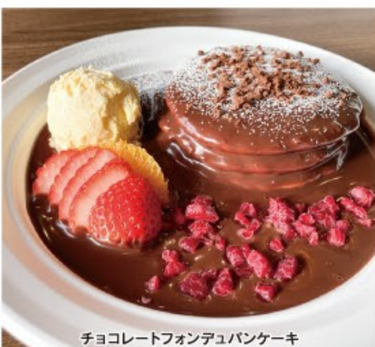
チョコレートフォンデュパンケーキ

本社(株式会社Works)/秋田市新屋南浜町1-10 営業 8:00~22:00 休 年中無休 秋田市・湯上市