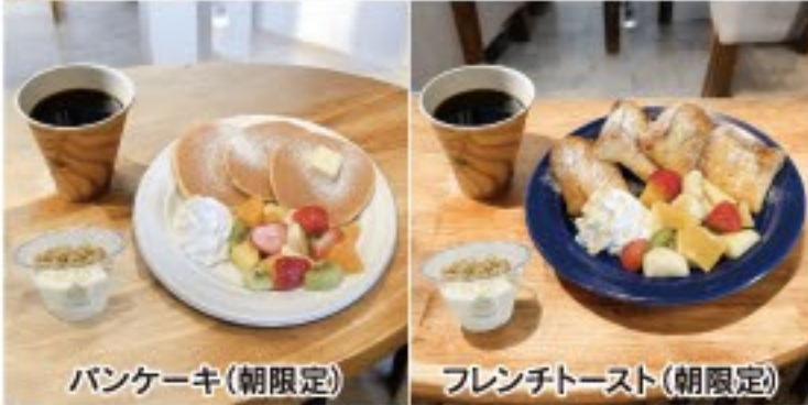
パンケーキ(朝限定) フレンチトースト(朝限定)