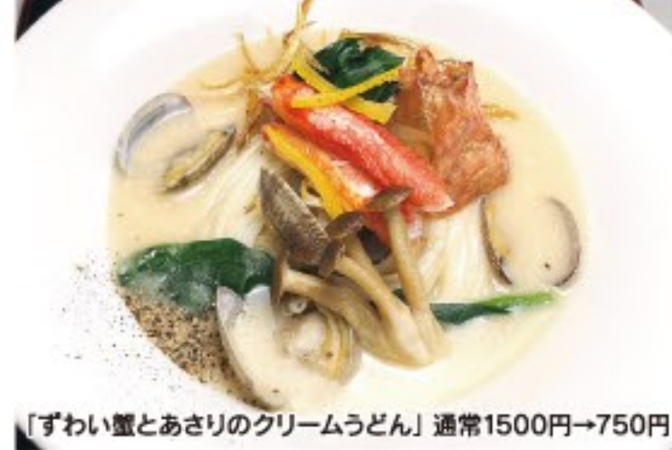
「ずわい蟹とあさりのクリームうどん」通常1500円→750円