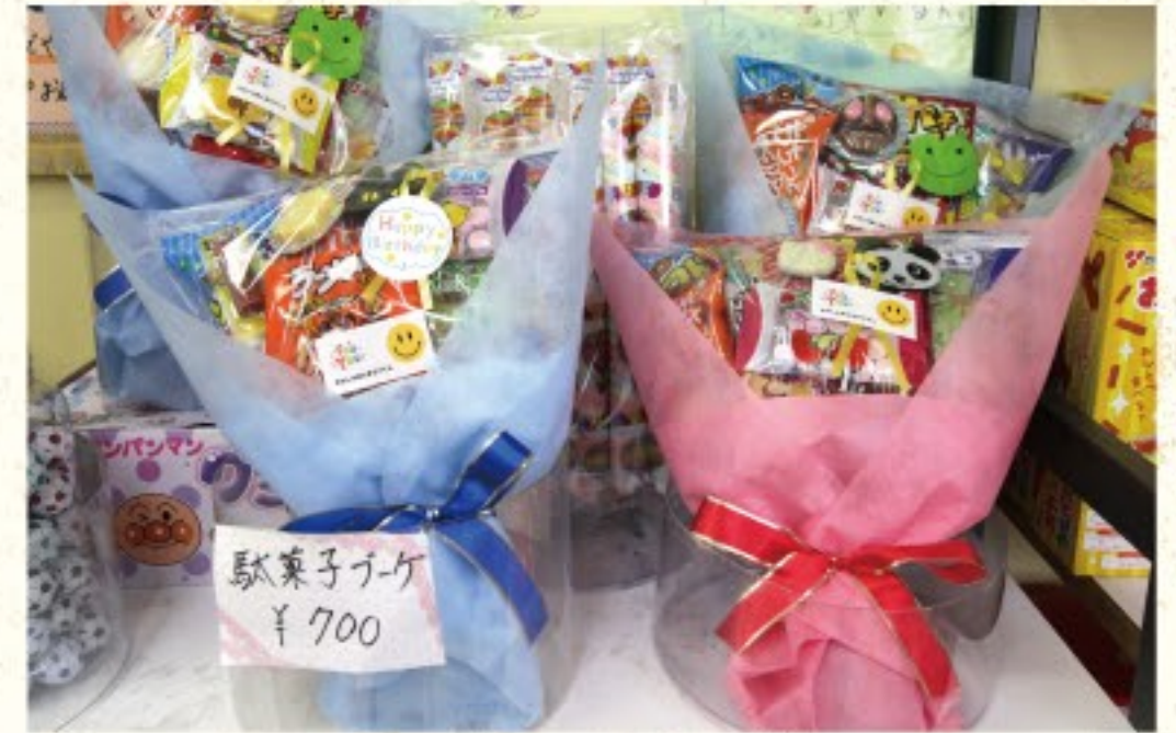
好きな駄菓子を選んで詰め合わせられる「駄菓子ブーケ」はプレゼントとして人気。