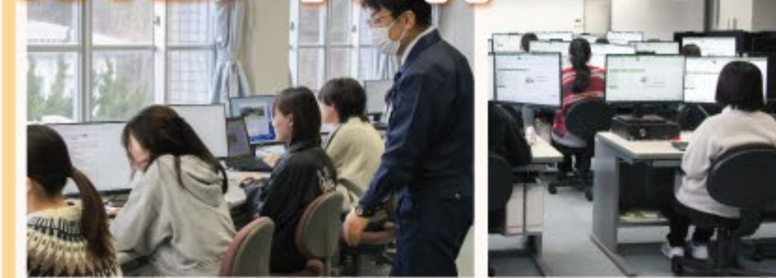
事務処理、ビジネスマナー、パソコンに関する知識・技術を始め、コミュニケーションやプレゼンテーション、さらにネットワークを活用したICTスキルを習得し、様々なビジネスシーンに対応できる人材を育成します。

2画面で授業・作業をします。PCや事務に関する様々な資格を取ることができるクラスです。 習った知識を活かして、会社から必要とされる人材になりたいです。周りから信頼される社会人を目指します。