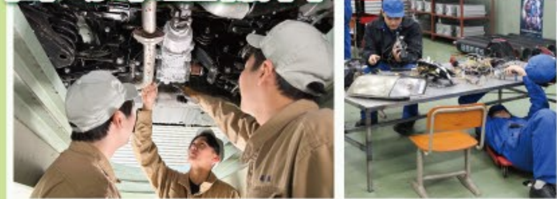
自動車整備士に必要な技術・知識を習得し、定期点検・車検整備・一般整備まで対応できる国家資格二級自動車整備士を養成します。ガソリン・ディーゼルエンジン、シャシ(車体等の各部品)の仕組みや構造、法令(道路運送車両法)などが学べます。

直接車に触れて学ぶ、実技の時間がカリキュラム全体の6割強となっているなど、とにかく車と向き合う学科です。 幼少期から車が好きだったので、オールマイティにこなせる整備士になりました。 ローターエンジンが好きなので、自分一人でオーバーホールできるようにになりました。