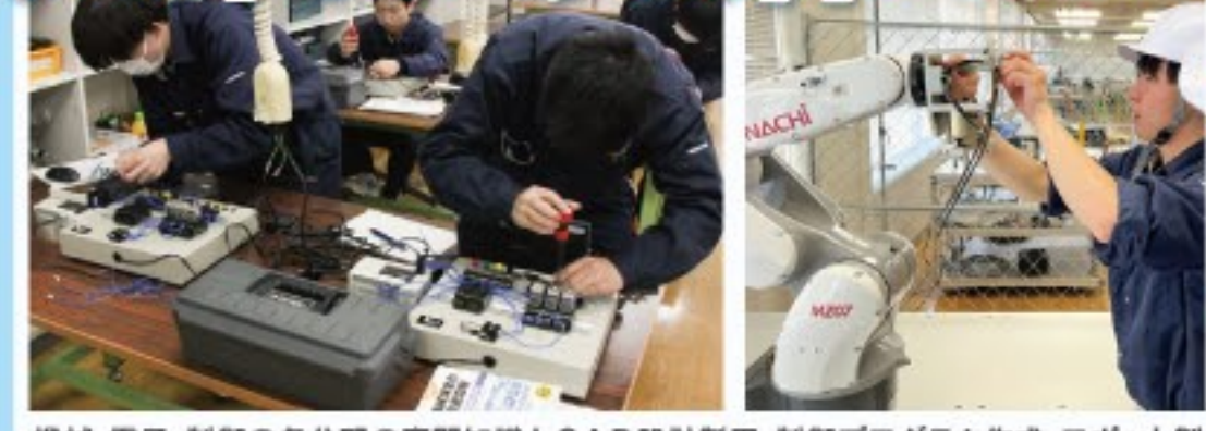
機械・電子・制御の各分野の専門知識とCAD設計製図、制御プログラム作成・ロボット製作等の総合的な技術を学び、製造における自動生産設備の設計・構築・メンテナンスに対応できる実践技術者を養成します。

製造業の大型の生産設備を動かすには必須の職種で、非常に高い需要があります。 工業的な専門分野を学びたかったところ、両親がこの専門学校を見つけて、提案してくれました。