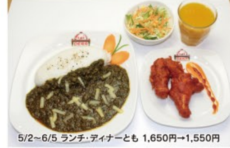
5/2~6/5 ランチ・ディナーとも 1,650円→1,550円