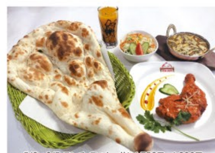
5/2~6/5 ランチ・ディナー共に1750円→1,600円