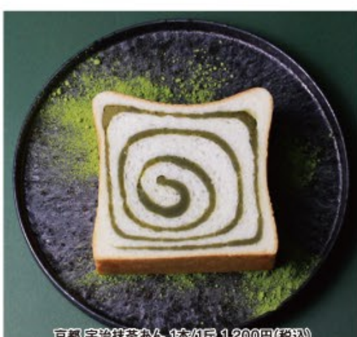
京都 宇治抹茶あん 1枚/1斤 1,200円(税込)