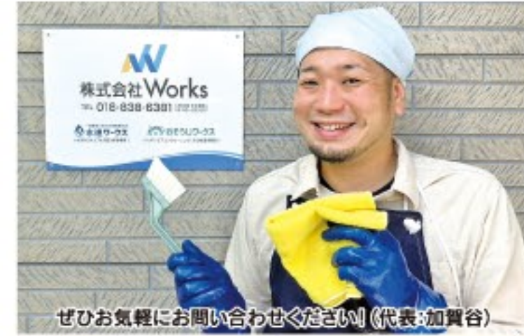
ぜひお気軽にお問い合わせください! (代表:加賀谷)