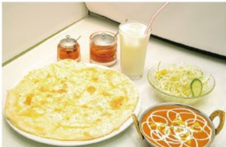
ガーリックバタークリームチーズナンSet 1600円→1450円