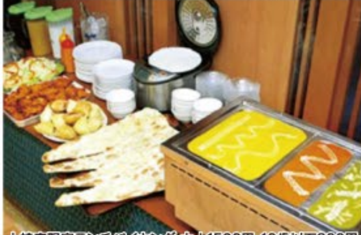
土崎店限定ランチバイキング 大人1500円・10歳以下800円