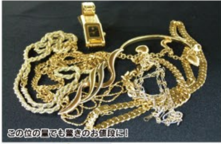
この位の量でも驚きのお値段に!