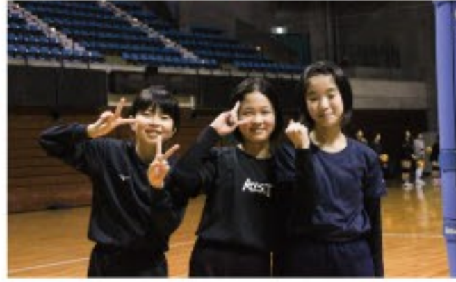
2時間しっかりと集中して、基礎練習と連携確認のためのミニゲームを行う選手たち。時折見せる楽しそうな表情で、バレーが大好きでとにかく上手になりたいという雰囲気を感じました。これから一年間、どのようなチームに成長していくのか非常に楽しみな1日でした。